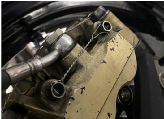
Borgen borgpennen remblokken